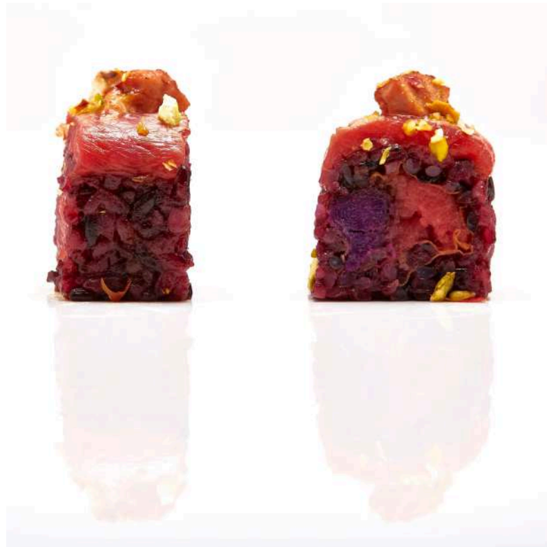
FOIE GRASS ROLL