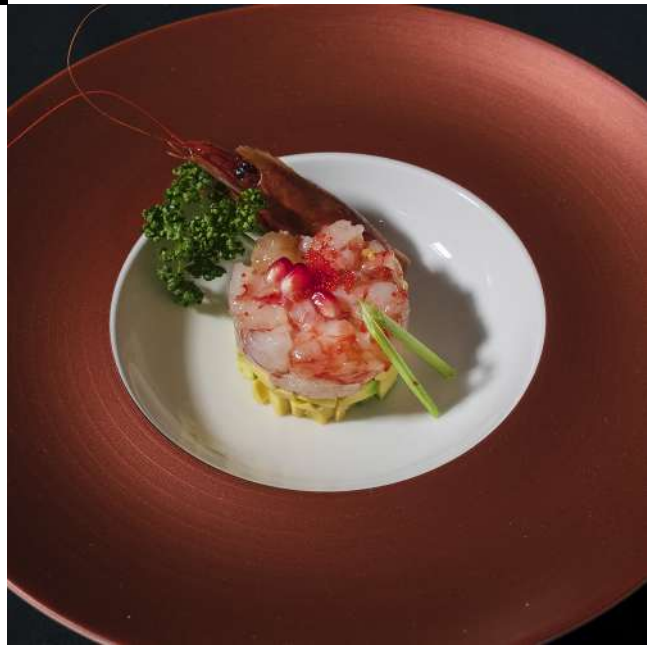
GAMBERO ROSSO DI MARZARA DEL VALLO