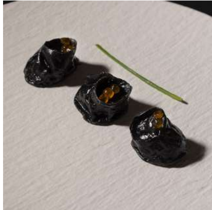
NERO DI SEPPIA