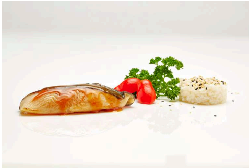
BLACK COD TERIYAKI