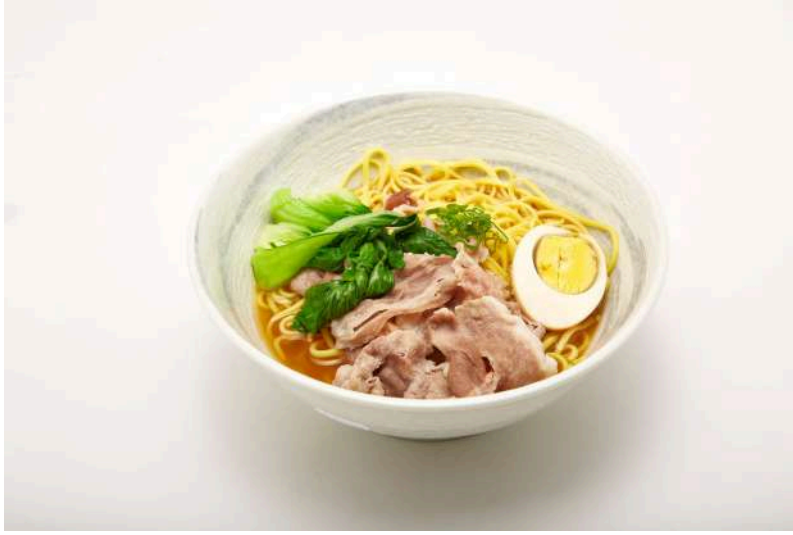
RAMEN DI CARNE