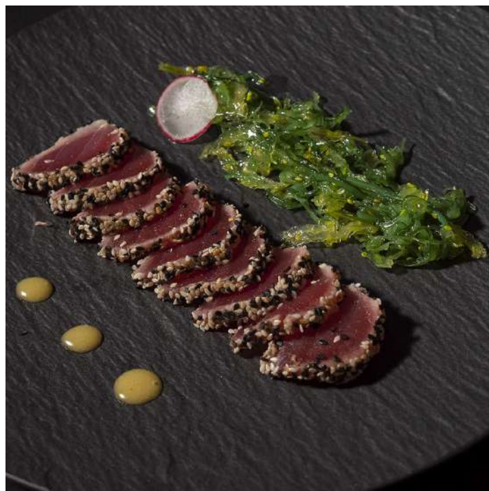
MAGURO NO GOMA FUMI