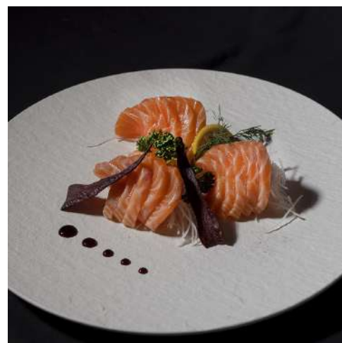
SASHIMI DI SALMONE