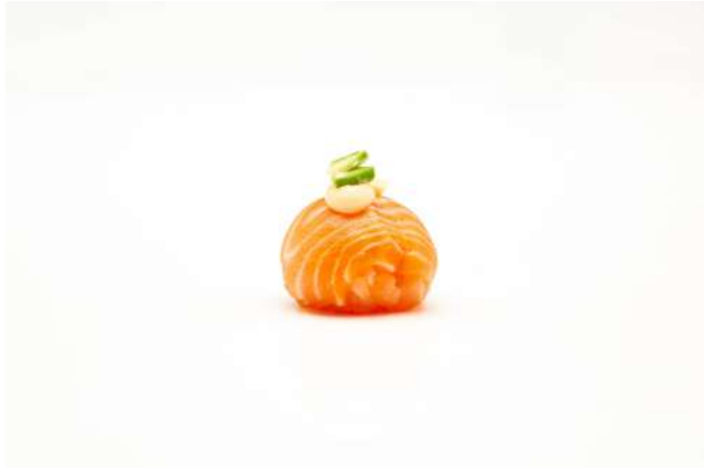
DRAGON BALL SALMONE