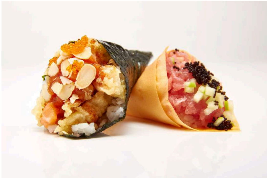
TIGER & MAGURO